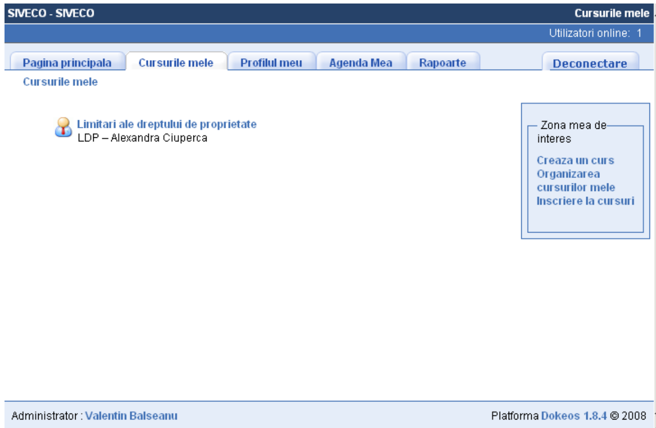
Figura 3. Deconectarea din aplicație

Pentru deconectarea din aplicație, se apasă butonul [Deconectare].